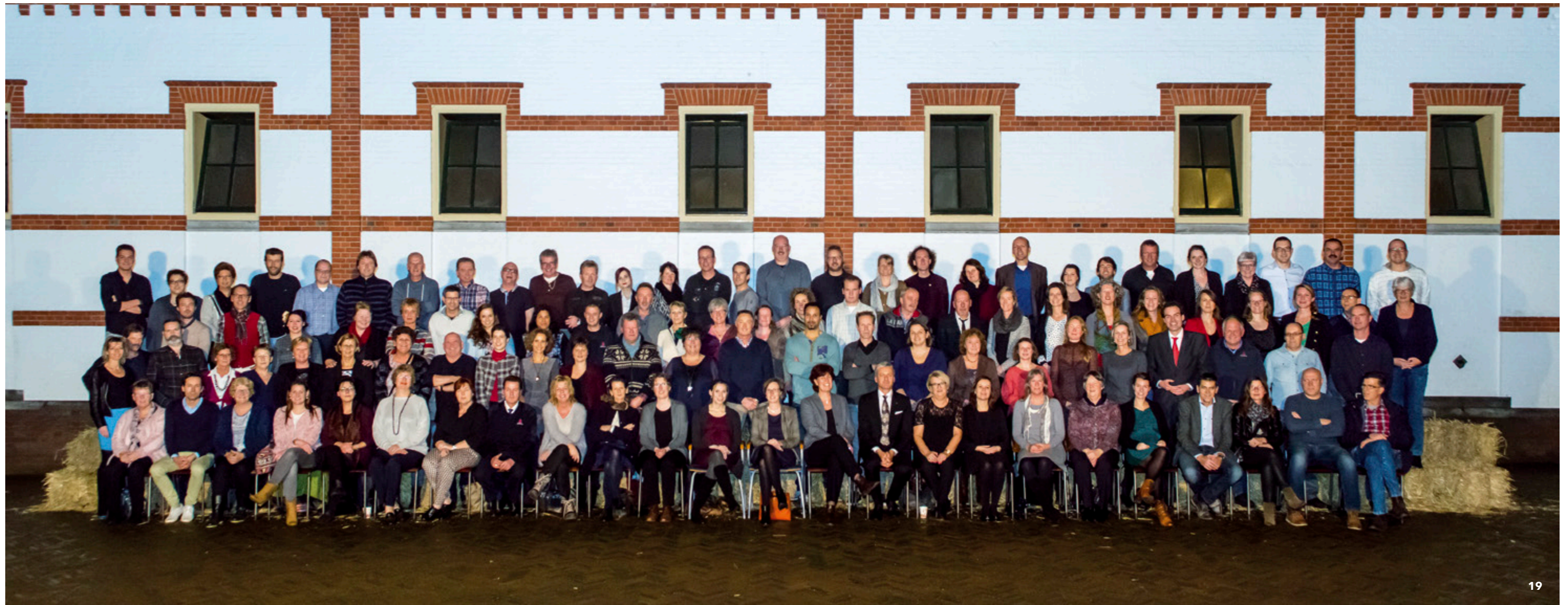
19 Medewerkers van Paleis Het Loo.