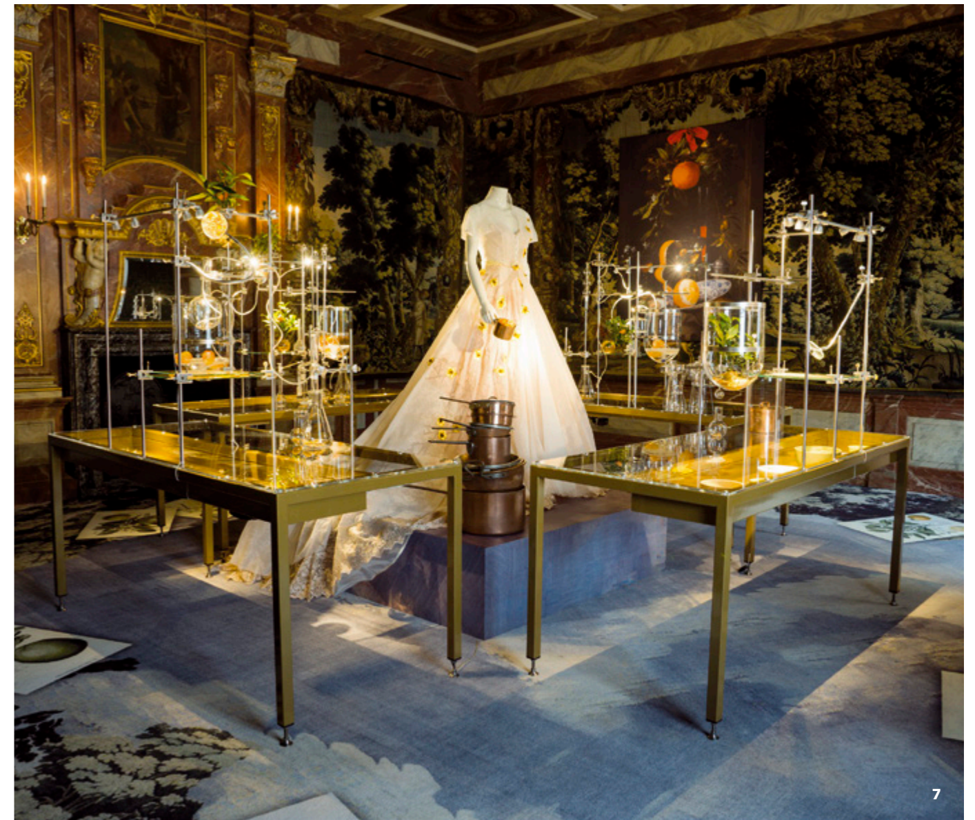
6 De opstelling persoonlijke spullen van Sisi en een impressie van de lengte van het haar van de Keizerin. Foto: Menno Mulder Photography. 7 Royal Showpieces II , in stijl opgediend. Thema 'tafelen' in de Oude eetzaal. Foto: Menno Mulder Photography.

Namens de Raad van Toezicht, GERDI VERBEET, Voorzitter