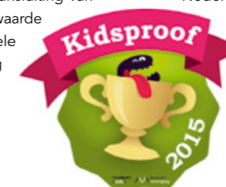
Paleis Het Loo werd Kidsproof in 2015.

In de herfstvakantie werd De Paleisreis georganiseerd in het Museum van de Kanselarij der Nederlandse Orde. De nieuwe kindervitrines waren een belangrijk onderdeel van de kinderrondleiding. Na afloop knutselden de kinderen hun eigen medaille. Vanwege de Rabo Museumkidsweek werd De Paleisreis gesponsord door Rabobank Apeldoorn en omgeving.