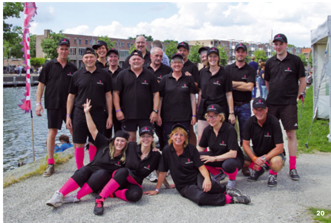
20 Het Paleis Het Loo-team dat deelnam aan de Drakenbootrace op 27 juni 2015 in Apeldoorn.

Enkele collega's gingen met pensioen of vonden elders een betrekking. Die werden vrijwel allemaal vervangen. We breidden ons personeelsbestand en functiehuis ook uit, onder anderen met een adviseur P&O, een sponsormanager, een financieel medewerker en oproepkrachten kinderactiviteiten. Het ziekteverzuim was relatief hoog: gemiddeld 6,64%. Dit werd met name veroorzaakt door lang verzuim (langer dan 43 dagen ziek, 5,2%) van enkele oudere medewerkers. De oorzaken waren grotendeels tegenspoed en deels de veranderende organisatie; de nieuwe werkwijze en het werktempo zijn niet voor iedereen direct haalbaar. We hebben in het verslagjaar daarom de nodige coaching en ondersteuning geboden, zoals cursussen in Outlook, Excel en Word, projectmatig werken en het nieuwe roostersysteem.